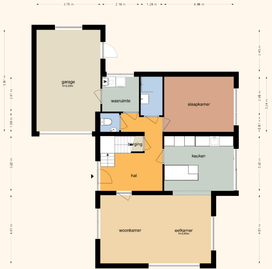
Noordstraat 18 - Retranchement Begane Grond